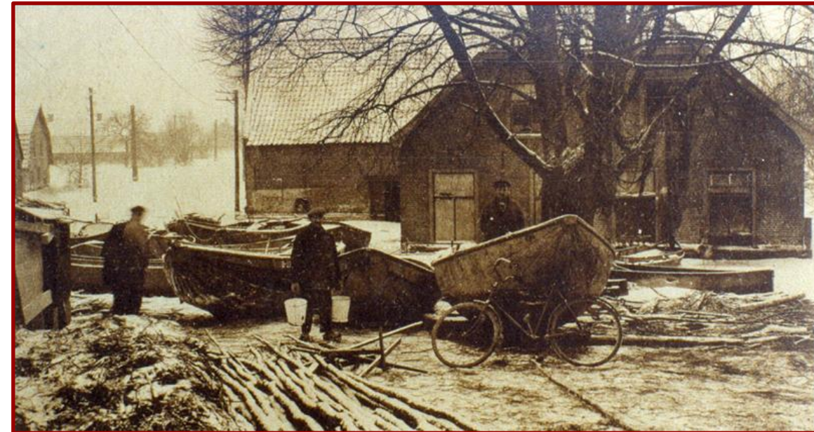
▲ Watersnood van 1926

In vroeger tijd was het in gebruik als boerderij, café, winkel en bakkerij.