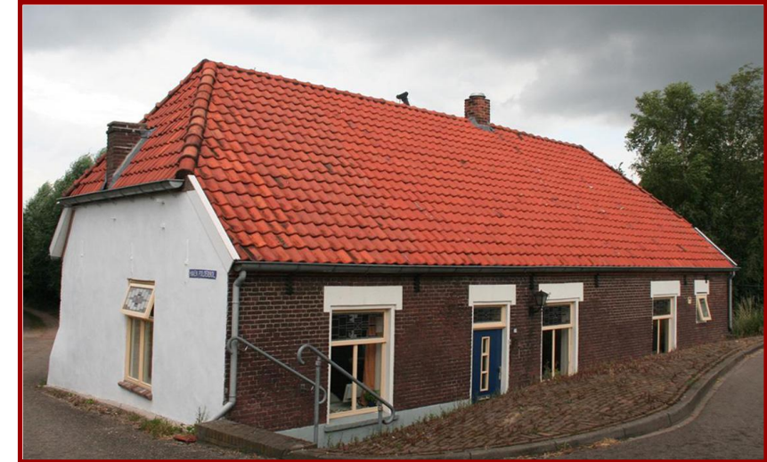
Het pand aan de Waldijk 11 wordt gedateerd tussen 1825 en 1850.