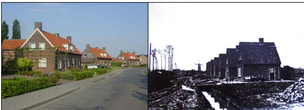
Hofhooistraat: Links: 3 blokken van 2 woningen gebouwd in 1948; rechts watersnoodwoning in 1926, gezien vanuit de Margrietstraat

Links over de drempel staan vanaf nummer 27 watersnoodwoningen (nrs. 27 t/m 39 + nr. 43), gebouwd in 1926, te herkennen aan het spitse dak en het dakdetail. Bijna alle woningen zijn inmiddels verbouwd en aangepast aan de eisen van deze tijd.