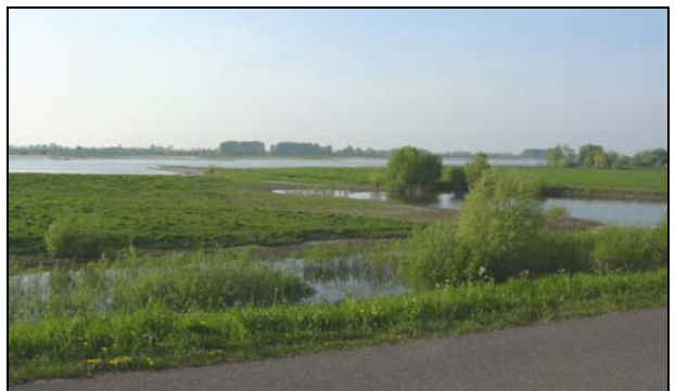
"Het gat van Voet"

Hier vind je ook het kunstwerk van Cor Litjens. Aan de ene kant van de zuil zie je een uiterwaardenlandschap met slechts een vervallen oven en een dijkhuisje. Aan de andere kant zie je allemaal bekende gebouwen.